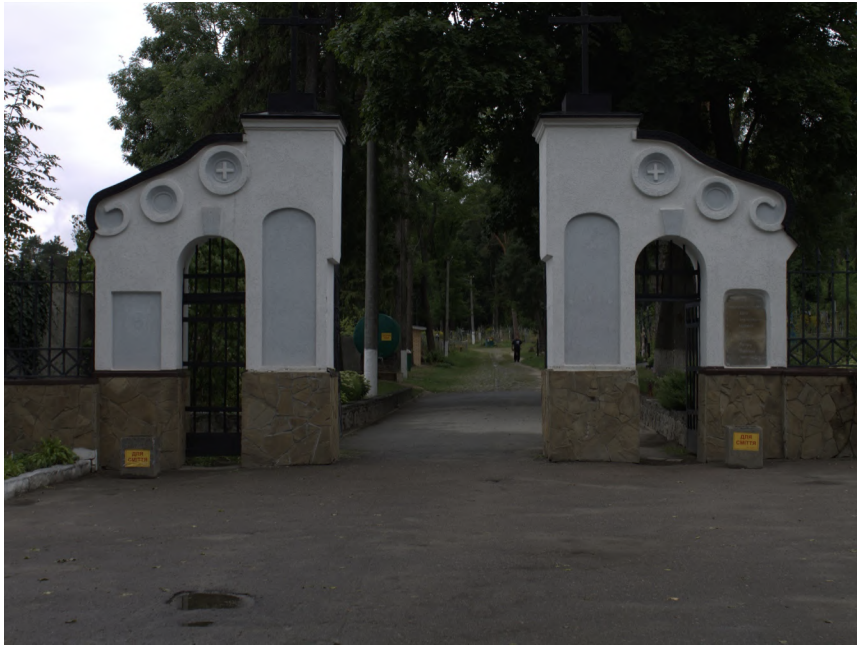
Фото 4b1: Вхід до Польського кладовища (сучасний вигляд)