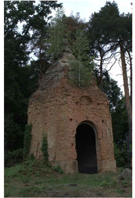
Фото 4b2: Склеп на Польському кладовищі (сучасний вигляд)