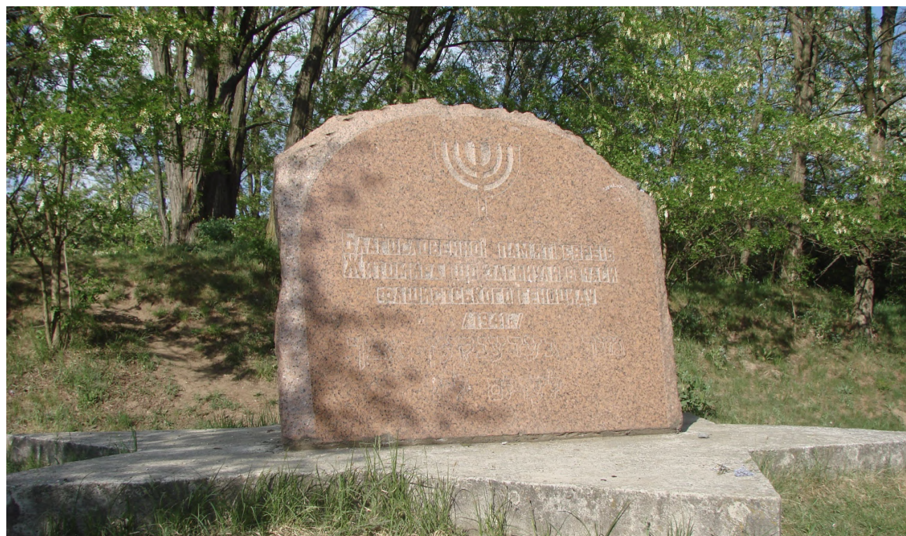
Фото 5: Пам'ятник жертвам Голокосту

Вказівка для гіда: показати на карті Житомира місце розташування пам'ятника жертвам Голокосту. Продемонструвати фото.