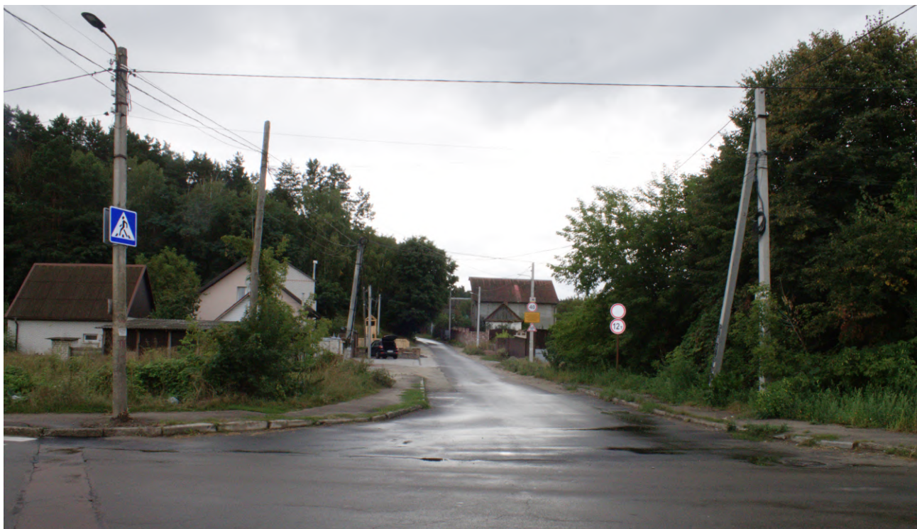
Фото 4а: Колишній хутір Шевченко, зараз – вул. Дачна (сучасний вигляд)