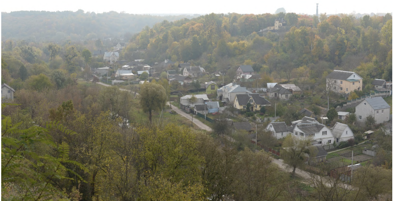
Додаткове фото 2b: Район, де переховувалась Фаїна (сучасний вигляд)