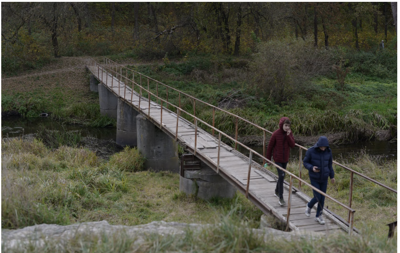
Фото 4с2: Яківлівський пров., зараз – Набережний пров., пішохідний міст