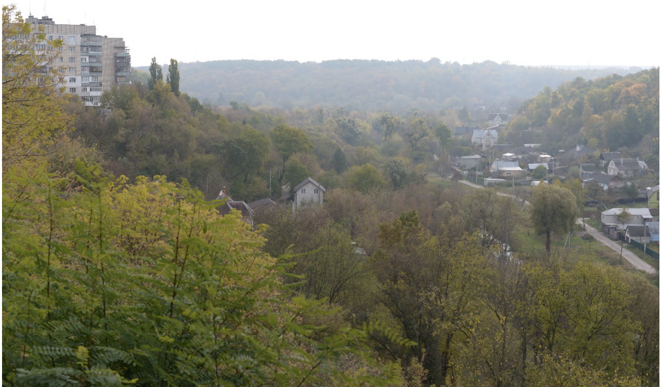
Додаткове фото 2a: Місце, де розташовувалось гетто (сучасний вигляд)