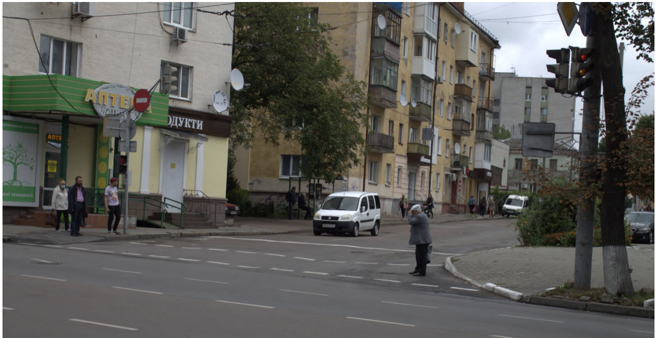
Додаткове фото Зс: Місце, де були Рибні ворота (сучасний вигляд)