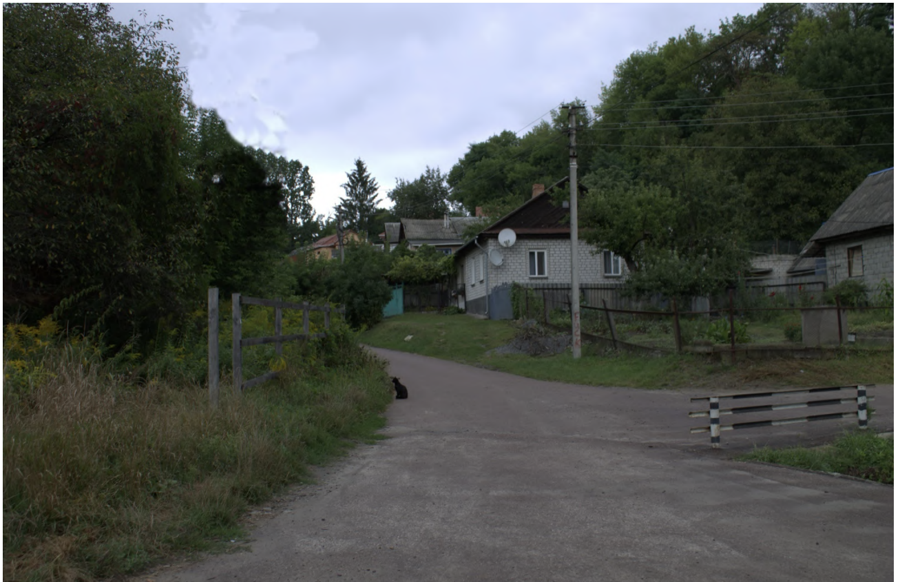
Фото 4с1: Яківлівський пров., зараз – Набережний пров. (сучасний вигляд)

Вказівка для гіда: Покажіть на карті Житомира Яківлівський пров. (зараз – пров. Набережний). Підкресліть тотальність та безкомпромісність нацистського геноциду.